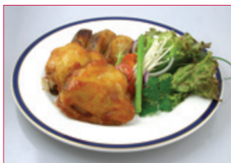
HUNANGLÆRI MED BÖKUÐUM KARTÖFLUBÁTUM OG SALATI