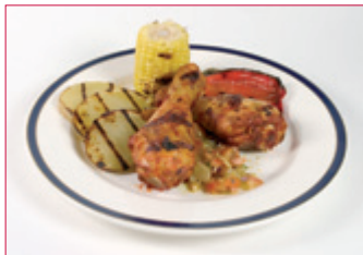
LEGGIR Í TEXASKRYDDLEGI