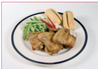
VÆNGIR Í HNETU- OG CHILISÓSU