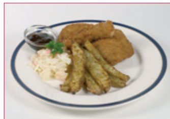
ELDFUGLS HJÚPAÐIR BITAR MEÐ SALATI OG KARTÖFLUSTRÁ