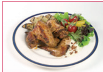
VÆNGIR Í MEXICOKRYDDLEGI