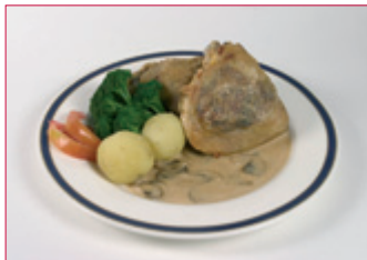
FYLLT FERSK LÆRI MEÐ SVEPPASÓSU