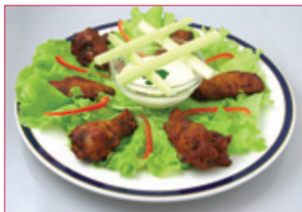
BUFFALÓVÆNGIR MED GRÁÐOSTA-SÓSU OG SELLERÍSTÖNGLUM