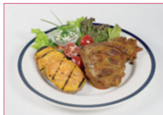
LÆRI Í HVÍTLAUKS- KRYDDLEGI